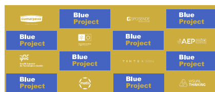
Conheça os parceiros